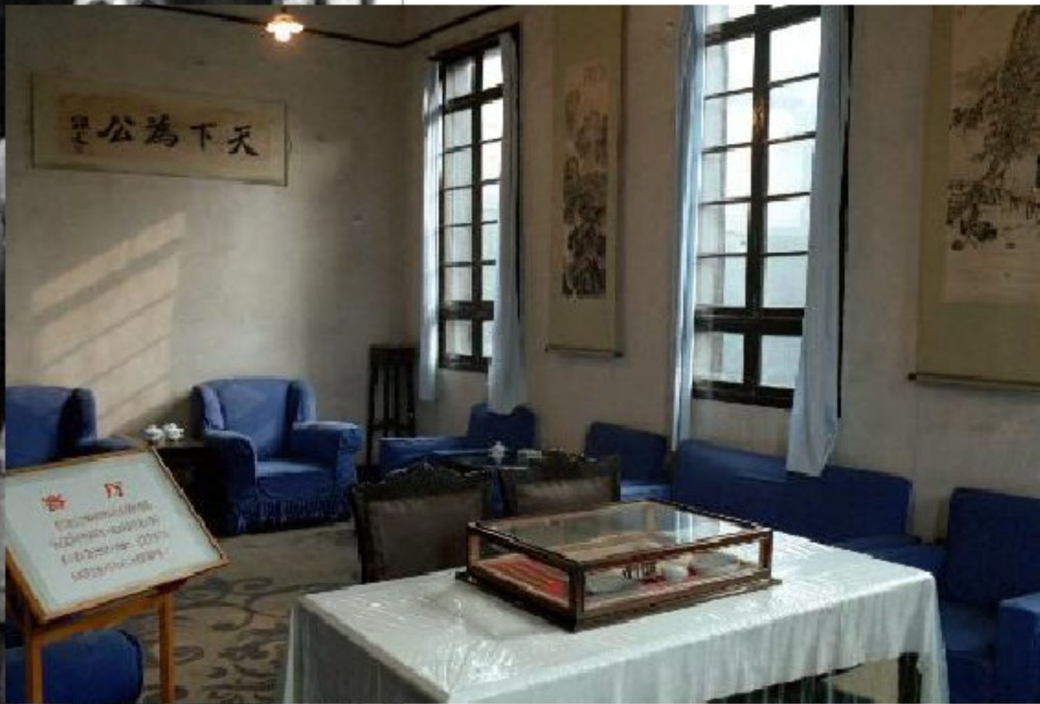
谈判地点 重庆桂园